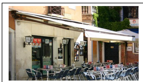
TENDE E TENDONI