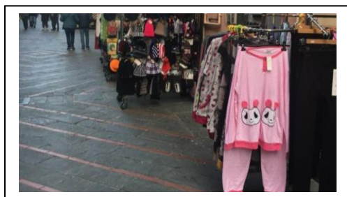
ESPOSIZIONE MERCE / ESPOSITORI INFORMATIVI ecc.