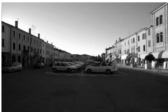
Parte dell'intervento interesserà Piazza Matteotti

L'opera persegue l'obiettivo di riqualificare l'immagine complessiva del centro storico di Gonzaga valorizzando le opere monumentali e architettoniche oggi appiattite da un'illuminazione diffusa e disomogenea. Saranno installate lampade master color per un'illuminazione artistica del centro nel rispetto della visione del cielo notturno. Notevoli saranno anche i benefici in termini di consumi energetici: si procederà con una smaltimento controllato di un grande numero di lampade ai vapori di mercurio che oggi caratterizzano gli apparecchi di illuminazione di piazza Matteotti , procedendo contestualmente all'installazione di nuovi corpi illuminanti con riduttori di flusso differenziati per tipologie di lampade. Per gli ambiti di progetto si prevede un risparmio energetico del 70% circa, passando da 93.492,00 kWh annui ad un valore di circa 29.141,00 kWh.